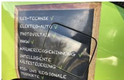
Transformationsberatung - Impuls Klimaneutralität

https://www.klimaschutz-niedersachsen.de/