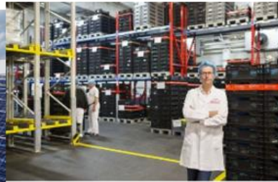
Transformationsberatung - Impuls Energie- und Materialeffizienz