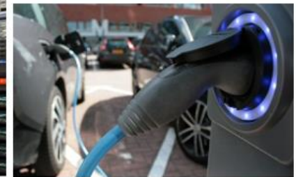
Impulsberatung für KMU - Betriebliches Mobilitätsmanagement