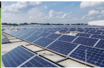
Transformationsberatung - Impuls Solar