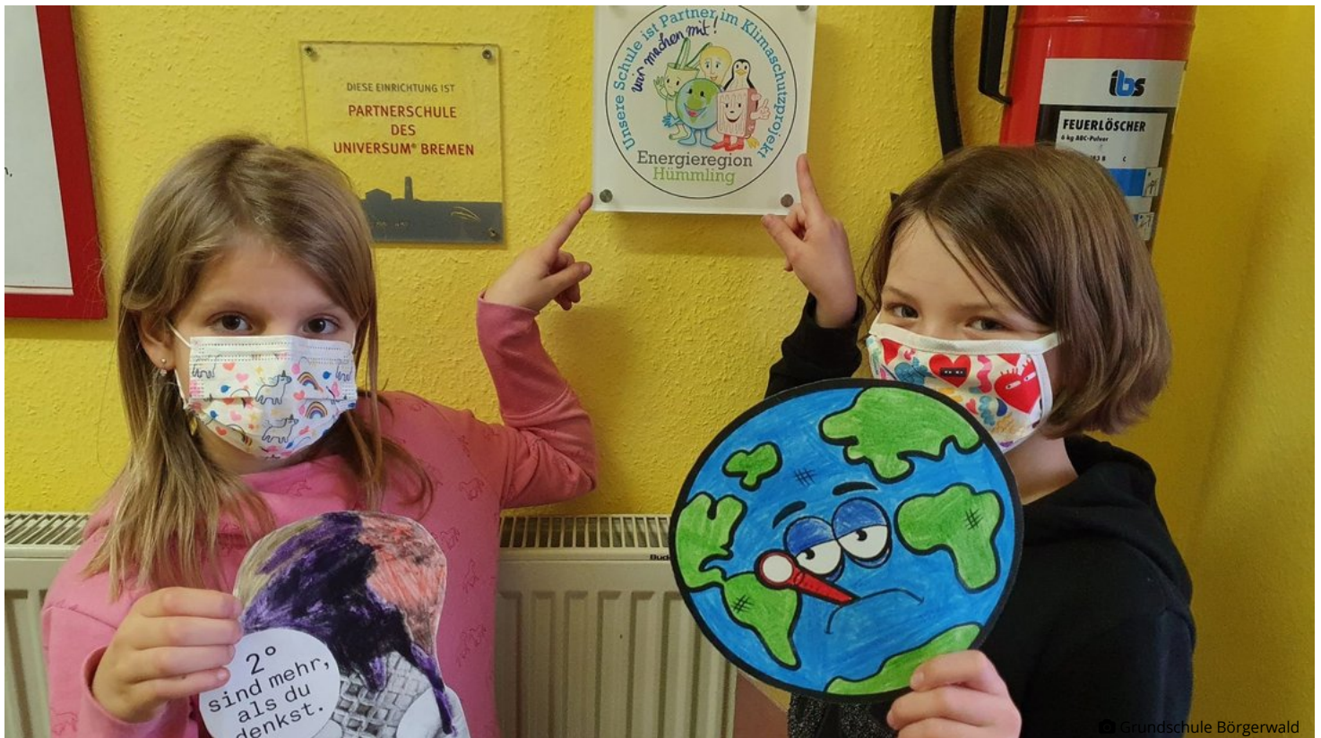
Stolz auf ihre Klimaschutz-Auszeichnung und das neue Schild sind die Schüler der Grundschule Börgerwald.